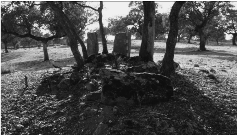
Dolmen: Cañada Morena I (Conquista)

Está ubicado en una pequeña loma desde donde se divisa por el N. Cañada Morena II. Posee parte de la estructura tumular, que aparece en forma oval, debido a acercarse por el E. y O. los arados; mide en el eje N-S: 7,50 m y en el E.O, 6m; conserva erigidos dos ortostatos que se localizan el uno en el O. que mide 0,90x0,40x0,30 y el otro en el S. y mide 0,90x0,50x0,30 cm, al pie de los mismos aparece una gran piedra de 1,10x0,30x0,15 cm y otras, una de ellas 1,30x0,25 y otra apoyada en la estructura tumular por la zona E. que mide 1,10x0,80x0,30 cm; conserva la estructura tumular una alzada aproximadamente de 0,70 cm; tiene un buen radio de visibilidad pudiéndose contemplar por el N. Sierra Madrona: la altura sobre el nivel del mar es de 676 m y crecen en la estructura cinco pequeñas encinas.