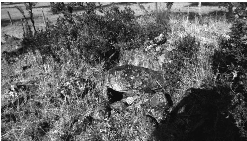
Dolmen: Tejoneras II (Conquista) Cámara funeraria

Posee cámara funeraria formada por varios ortostatos, pero aparece cegada por piedras y no acaba de dejarse ver, porque parte de ella la ocupa una gran piedra de 1,10x1,00x0,35 m que podría pertenecer a parte de la cubierta; el diámetro de la estructura tumular es de 18 m; y tiene una alzada aproximada de 1,80 m; la piedra que contiene esta estructura es toda ella de cuarzo blanco grisáceo, y la cámara; por el contrario, es de granito gris, mide la misma 1,90x0,90x1,90 m; la altura sobre el nivel del mar es de 656 m y se localiza a unos 150 m al N. de Tejoneras I.