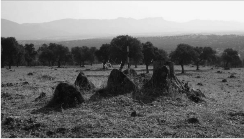
Dolmen: Tejoneras I (Conquista) visto desde el S.