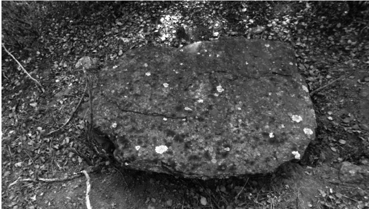
Dolmen: Nava Grande (Conquista) ¿Piedra de cubierta?