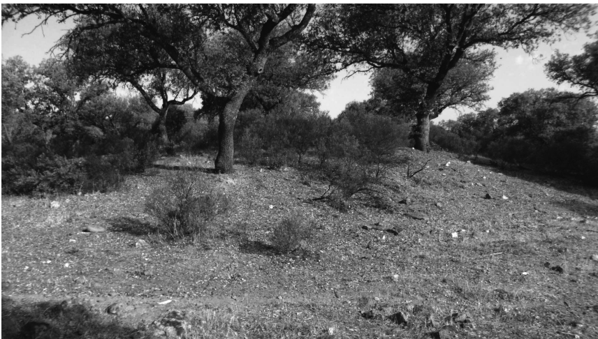
Dolmen: Nava Grande (Conquista) visto desde el E.

Mide esta estructura tumular 20 m de diámetro, y se alza sobre el territorio aproximadamente 1,80 m, estando casi toda ella cubierta por jaguarzcos, sobre la estructura tumular se aprecian diversas piedras medianas, entre ellas distinguimos una plana que pudo haber servido ¿de cubierta?. Mide 1,00x0,90x010 cm; no se aprecian ortostatos, y la estructura tumular está compuesta por pequeñas piedras y tierras compactadas, por el S.E. aparecen muchos nódulos pequeños de cuarzo blanco; este túmulo está situado a 40m a la izquierda del camino, y no ofrece obstáculo alguno hasta el mismo; la altitud sobre el nivel del mar es de 666 m.