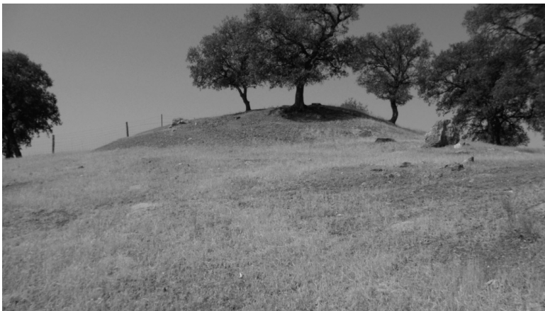
Dolmen: S. Gregorio (Conquista) visto desde el E.

Se ubica sobre una elevación que la hace visible a gran distancia, en un magnífico otero desde el que se divisa por el N. y E. todo el valle del río Guadalmez; mide el cono tumular 36 m de diámetro y la altura de esta estructura es aproximadamente dos metros; esta “cortado” el túmulo por una alambrada de malla cinégetica y alambre de espino que separa dos propiedades distintas; en el S.E. de dicha estructura aparece una hendidura un tanto aterrada, lugar este que pudo haber ocupado la cámara funeraria y el corredor; en el lado S. de la estructura tumular aparecen grandes piedras; la 1ª mide 1,20x0,70x0,15, la 2ª 1,30x0,80x0,15 y la 3ª 1,70x1,00x0,15 cm; apareciendo en el mismo lugar dos más que aparecen soterradas, pudiendo haber formado parte de las estructuras de la cámara funeraria o del corredor. La altitud sobre el nivel del mar es de 630 m