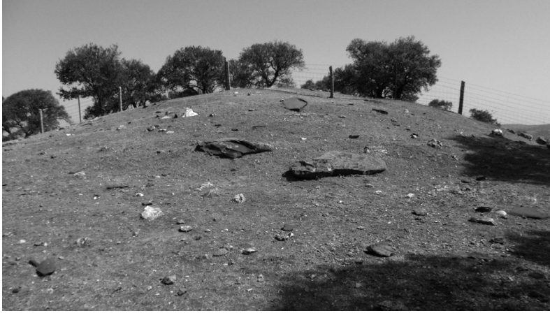
Dolmen: S. Gregorio (Conquista) visto desde el S.