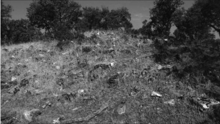
Dolmen: TEJONERAS II (Conquista) Estructura tumular

Los dólmenes encontrados por nosotros en este municipio serán declarados a la Delegación de Cultura Provincial, dependiente de la Consejería de Cultura de la Junta de Andalucía, para ser registrados junto a los ya catalogados y declarados por nosotros, si procede, en el Catálogo General del Patrimonio Histórico de Andalucía.