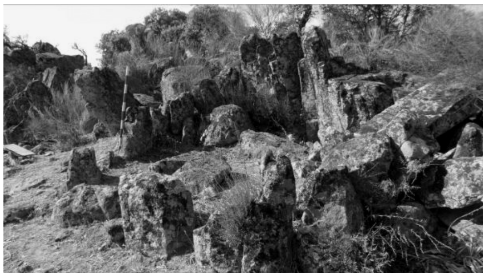
Tholos: Cañada Morena II (Conquista). visto desde el S

Este tholos está ubicado y apoyado por el N. en un afloramiento de pórfido rojo que tuvieron que “tallarlo” para la construcción de la cámara funeraria, aparecen dieciséis ortostatos con alineación circular que posibilitan la formación de la misma sobresaliendo de la estructura tumular 0,70 m, unos más y otros menos. El pasillo o corredor, muy corto, está orientado exactamente al E. sobre el que cae un gran piedra que mide 1,60x0,60x0,50 m; la cámara funeraria tiene 3,30 m de luz, apoyándose en una estructura tumular de piedras y tierra compactada de 7 m hasta el interior de la cámara y una altura aproximada de 1,30 m; carece de cubierta y la altura sobre el nivel del mar es de 666 m.