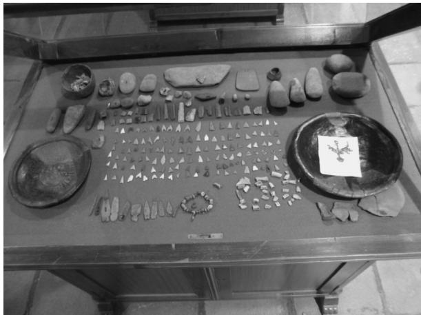
Tholos Minguillo IV. (Vva de Córdoba). Ajuar funerario. Junto con varias piezas del mismo periodo.