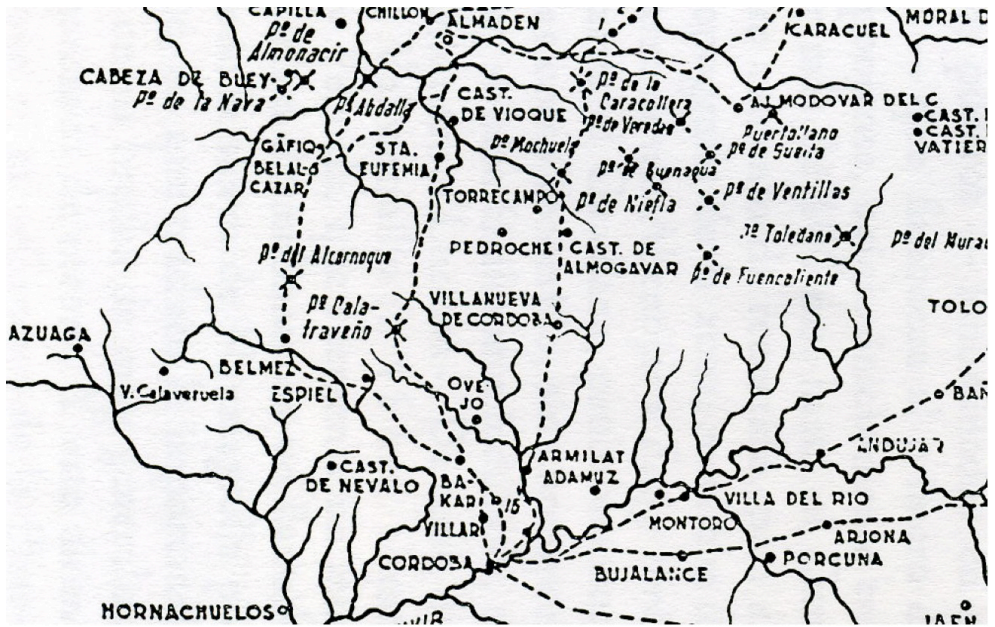
Los Caminos de Córdoba a Toledo según F. Hernández Giménez .