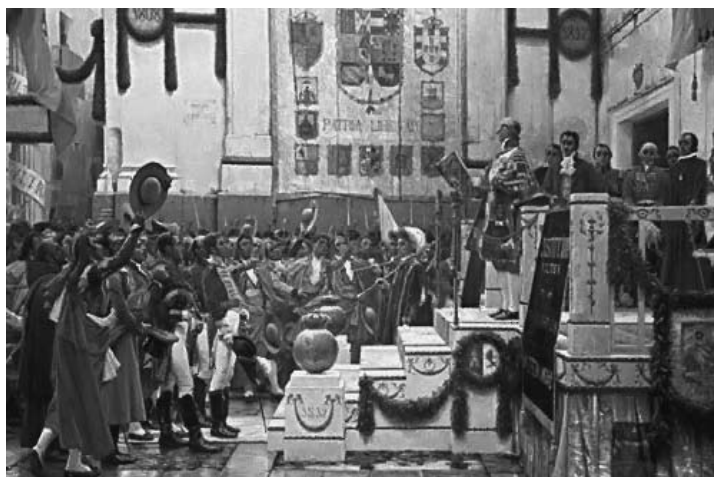
Prormulgacion de la constitución 1812

Sin embargo, la mayoría de estos avances tuvieron que esperar hasta la llegada del trienio liberal (1820-1823) para ser desarrollados, periodo de la historia contemporánea