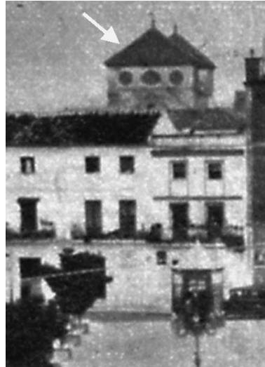
Convento de las Clarisas