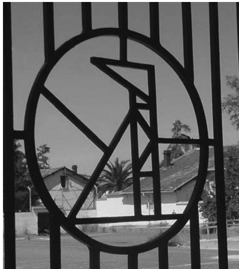
Logo ENCASUR en una ventana de la Dirección

Desde primeras horas de la mañana el Campo Municipal de Deportes de “Casas Blancas” docenas de productores ultimaban los detalles para la organización del acto que había de celebrarse allí aquella misma tarde, mientras llegaban constantemente vehículos transportando las bolsas con las que serían obsequiados las 3500 personas que se preveía asistieran. Además de altavoces, se habían colocado un gran número de banderas nacionales y, junto a la puerta principal otras tres grandes banderas sobre altos mástiles en los que ondeaban las del Régimen: la nacional flanqueada por las dos del Movimiento, la rojinegra de Falange Española y de las JONS y la blanca con el aspa rojo de la cruz de San Andrés, de los tradicionalistas. Bajo ellas el escudo del Instituto Nacional de Industria (INI) en medio de dos de ENCASUR. Y es que, organizado por esta empresa, se iba a celebrar en la localidad el XX Aniversario de la fundación del INI para todo su personal «desde el Director al más modesto peón» 3 , como se enfatizaba desde la emisora que dirigía Pedro Izquierdo y como luego se hizo en la prensa local.