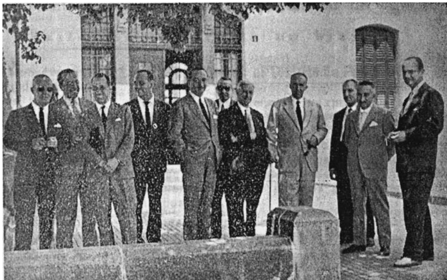
Consejo de dirección de ENCASUR

en España. Aunque se hablaba de su montaje a bocamina «para el aprovechamiento hidroeléctrico del río Guadiato» y «teniendo en cuenta las conexiones con la nueva red de distribución» , tras los preceptivos estudios técnicos, el largo brazo del cordobés ministro Conde de Vallellano conseguiría finalmente su ubicación en el relativamente lejano lugar de Puente Nuevo (Espiel), una central termoeléctrica con dos grupos generadores de 30000 kilowatios cada uno y una utilización mínima de de 4500 horas-año, que necesitarían un cupo anual mínimo de 120.000 toneladas/año por grupo. Esta empresa eléctrica, que inicialmente arrendaría la vieja central termoeléctrica francesa de Peñarroya-Pueblonuevo por un precio simbólico y manteniendo el personal. Se llamaría luego ENECO y estaría participada minoritariamente por la Compañía Sevillana de Electricidad. Recibiría los suministros de la nueva empresa carbonera de una manera garantizada con combustible obtenido exclusivamente de la cuenca de Peñarroya-Belmez-Espiel durante un periodo mínimo de 24 años. Esta nueva empresa mixta sería participada en un 17% por la SMMP que le traspasaría unos 1600 trabajadores, el Hospital empresarial, el Almacén Central, las instalaciones y el material del ramal ferroviario y las explotaciones mineras divididas en dos grandes grupos: