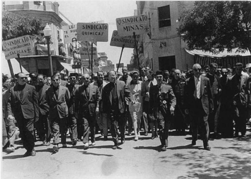
Cabecera manifestación 30-7-1961