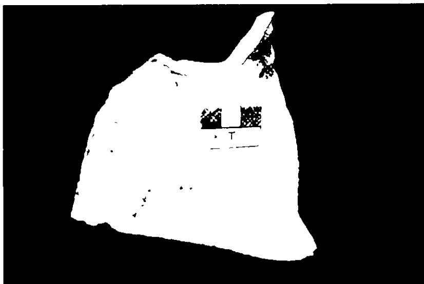
4 Titulus pictus Museo Histórico Municipal de Fuente-Lojar

Se trata de un fragmento irregular de aspecto trapezoidal con bordes mixtilíneos correspondiente al cuello de un ánfora fabricada a torno del tipo 25 Dressel