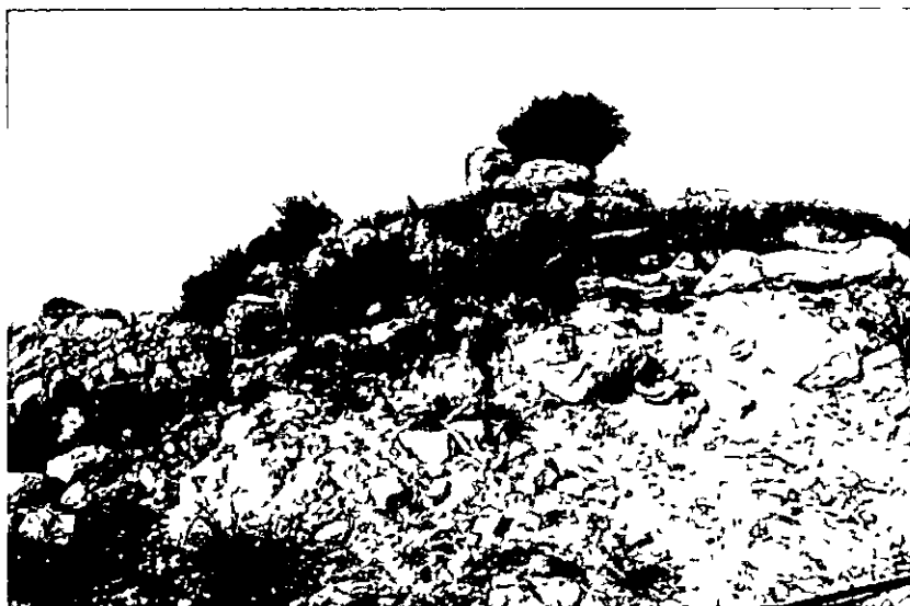
3 Los Castillejos primera destrucción en 1992

“El recinto fortificado de Los Castillejos” se alza en el cerro de su nombre. Esta compuesto por varios anillos de murallas 6 y debió ser uno más de los oppida ibéricos, en calidad de avanzadilla de la ciudad de Illurgicola, infra 7 . El yacimiento se halla al S del río Salado, afluente del Guadajoz. En sus cercanías abundan los acebuches - olea europaea - especie oleícola que fue ampliamente cultivada en tiempos de Roma.