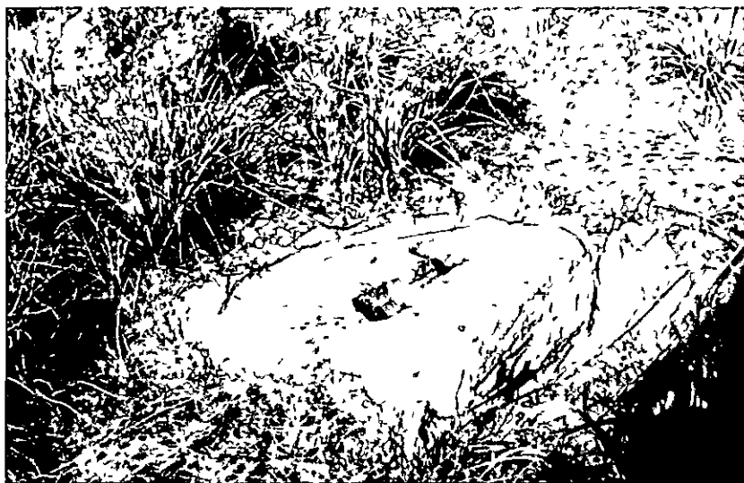
1 Pie de prensa in situ Los Castillejos 1992

El actual trabajo es continuación de otro que, en 1996, presentamos en Montoro (Córdoba) con el título "Producción de aceite en Fuente-Tójar (Córdoba) en Época Romana". Ambos son, por tanto, complementarios, si bien, este está en relación con el yacimiento de Los Castillejos, 1 m de Priego de Córdoba 1 lugar en donde habíamos detectado en noviembre de 1981 un pie de prensa (lam. 1) semejante a los descubiertos en El Lucerico, villa romana con un vasto complejo aceitero, motivo de nuestra comunicación en Montoro (Córdoba)