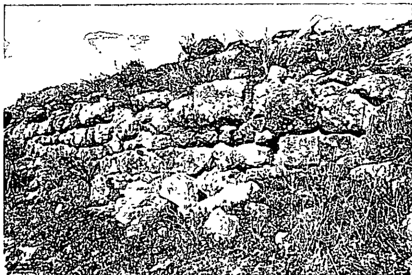
2. Los Castillejos. 1992.