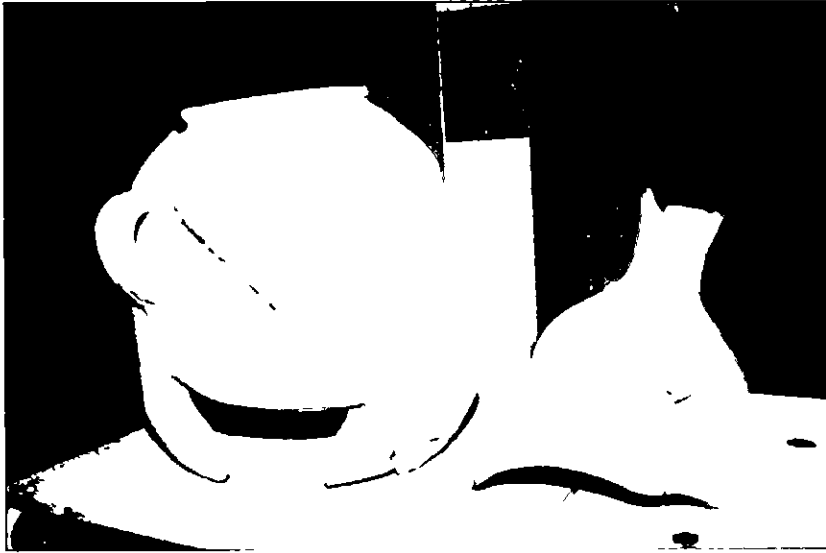
5 Anforas procedentes de Las Castillejos Museo Historico Municipal de Fuente-Itojar

C 11 , y sin que aparezca falsilla alguna ni capa de preparacion sobre el ánfora, el amanuense realizo unos trazos elegantes en la superficie de la misma