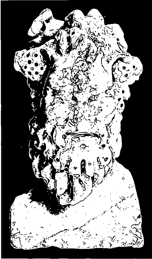
Lámina 1. Busto báquico de Fuente-Tójar (Museo Histórico Municipal de Fuente-Tójar, Córdoba).