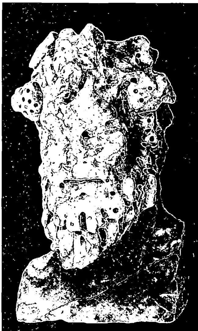
Lámina 2. Herma de Baco (Museo Histórico Municipal de Fuente-Tójar).

procedentes de Nueva Carteya, de origen desconocido y de la calle Cardenal González, respectivamente 23 . Tampoco hemos observado similitud con el herma arcaizante imberbe de Almedinilla, aunque sí con la de Dyonisos (sobre todo en el tratamiento y representación del peinado) aparecidas en la villa de El Ruedo 24 , uilla ligada directamente a Iiturgicola.