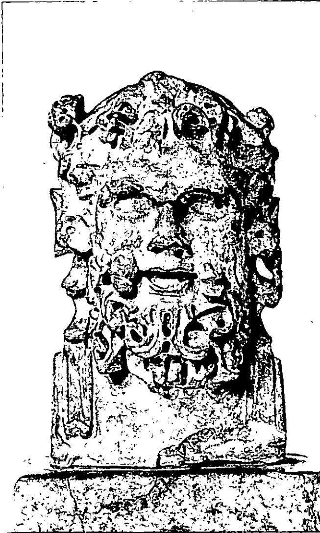
Lámina 3. Busto báquico de Porcuna (Jaén).

Tanto las esculturas cordobesas, como las de Porcuna y de Fuente-Tójar, así como otras imágenes de dioses domésticos, por ser la personificación de una energía, se hallaban presentes en el Lararium , el tablinum , o bien en huertos y jardines. Son Libero, Baco, Sileno, Silvano, Flora, Ceres... quienes, representados en forma humana -en mosaicos y esculturas- 25 presidían y adornaban los huertos, las fuentes y los bosquecillos (p.e., el peristilo de la casa de los Vettios, en Pompeya) protegiendo las cosechas y los ganados de los dueños del lugar, que, agradecidos,