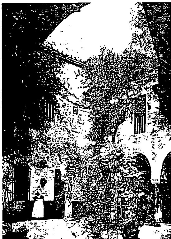
Patio del Hospital de San Juan de Dios. Andalucía Ilustrada (junio 1926).

en que están constituidos los niños Expósitos, entiende el Ayuntamiento ser muy útil la agregación del Caudal que pretende, para un objeto tan piadoso que merece tanta consideración 27 .