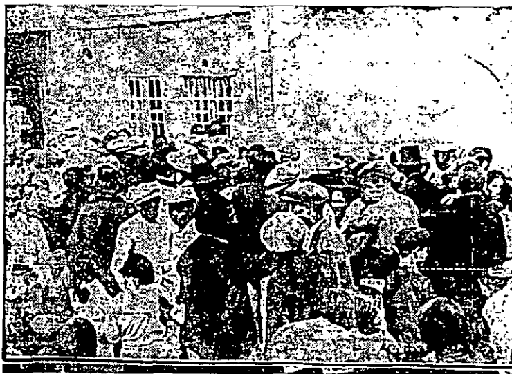
Inauguración del Comedor de Caridad de Bujalance. Ilustración de "La Voz" (5 de abril de 1934).

El 2 de agosto de 1877 33 el Ayuntamiento acordó solicitar a la Excma. Diputación Provincial la instalación a su cargo de la "Hijuela de Expósitos de esta ciudad en el Hospital de San Juan de Dios de la misma, y también que costeara dos Hermanas de la Caridad que unidas a otras dos que el municipio acordó traer y sostener en sesión de veintidós de julio de mil ochocientos setenta y cinco, prestasen en pro de seres que tanto lo necesitan sus buenos oficios y afanes" 34 . En sesión de 18 de octubre de 1877 la Excma. Diputación accede a los deseos de Municipio aceptando la instalación de la Casa de Cuna de esta Ciudad, en un departamento del Hospital de San Juan de Dios de la misma, siendo a cuenta del Ayuntamiento los gastos que ocasione la instalación y los reparos en el edificio, y de cuenta de la Diputación el salario y manutención de las dos Hermanas de la Caridad que han de aumentarse para el cuidado de los Expósitos 35 .