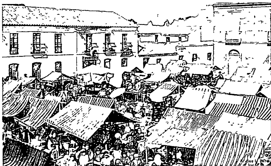
Mercado de abastos de Pueblonuevo del Terrible (antes de 1905)

Pero para los nuevos colonizadores estas construcciones no solo les servían para vivir, sino también, por lo radicalmente distinto de las de esta zona, como demostración del poderío económico-social de la empresa y de la propia cultura de su país de origen. Buscando la proximidad a este poder fáctico y tangible, se instalaron empleados y comerciantes, además de obreros, y se construyó por los dueños de la compañía de los Ferrocarriles Andaluces una pequeña y humilde iglesia para remarcar el carácter burgués, del nuevo y floreciente núcleo de Pueblonuevo y en dos de los laterales de las eras de El Llano se construyeron casas ajardinadas para demostrar a donde quedaba el centro neurálgico de la nueva población, que recibiría el nombre de Pueblonuevo del Terrible unificando la parte obrera y burguesa, e intentaría la segregación de la villa belmezana ya en 1886 de la mano de los intereses de la recién creada Sociedad Minera y Metalúrgica de Peñarroya (SMMP).