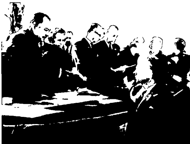
XII-1966 Entrega de títulos de arrendamiento a los nuevos inquilinos del poblado Santiago García Fuentes