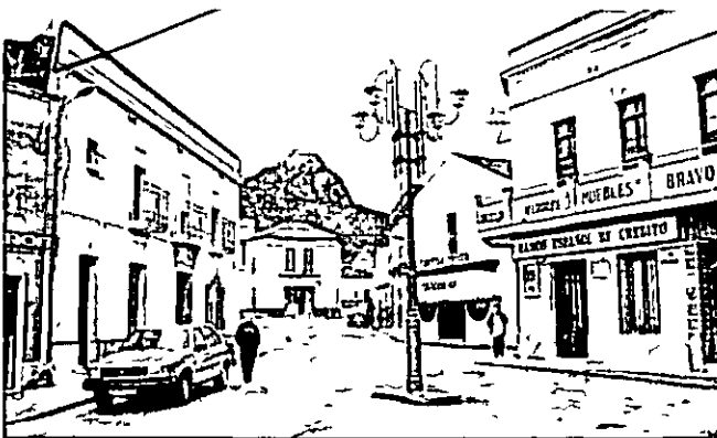
La Farola en el distrito de Peñarroya en los primeros años 90

la del centro, hay unos cuantos altares en los que la fe y la piedad han reunido un numero de imagenes algunas de bastante merito artistico. En la nave de la derecha hay un hermoso cuadro al oleo con "La Oracion del Huerto" y en el altar, el Corazon de Jesus, la Virgen del Carmen y Santa Lucia. Otro altar con la Puri-