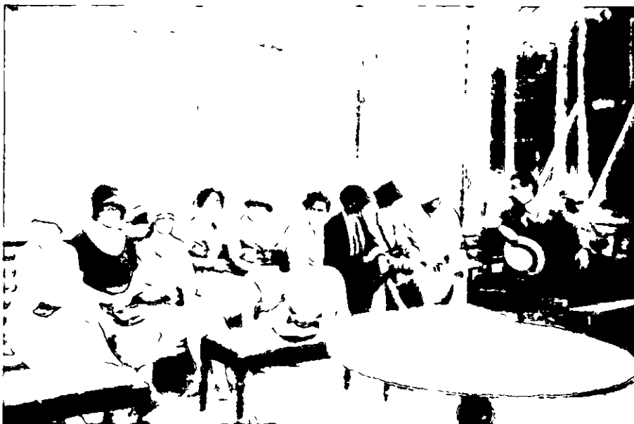
1928 Espectadores durante un match de tenis en el Cerco Frances

Casi paralelamente se habían iniciado las gestiones preliminares ante el Ministerio de Instrucción Pública y Bellas Artes para conseguir la instalación en esta Villa de un Instituto Local de 2ª Enseñanza, que para las autoridades locales se consideraba como una aspiración irrenunciable dada la inexistencia de ningún establecimiento de esta clase en la zona norte de la provincia, la pujanza económica y el