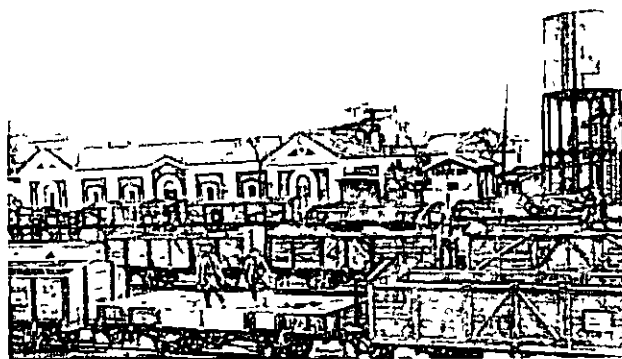
Estacion Peñarroya edificio de la MZA desde el de la del Peñarroya-Puertollano

que en el caso de las de ancho nacional necesitaban una evidente renovacion en sus infraestructuras y material rodante que aseguraban las comunicaciones con Extremadura, La Mancha y el resto de Andalucia, ya que existian tres estaciones ferreas en el interior del casco urbano dos pertenecientes a la linea metrica de la Compania de los Ferrocarriles de Peñarroya-Puertollano y una perteneciente a la