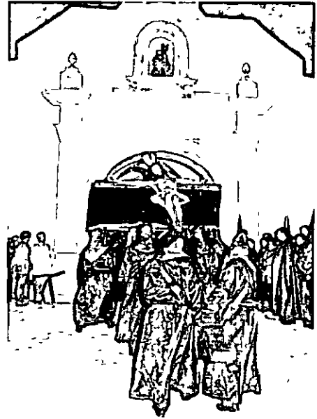
El Cristo de la Buena Muerte saliendo de la ermita

tejo prosigue su marcha. Al llegar a la Plaza, desde un balcon de la esquina sale una voz potente y modulada que hace enmudecer a la banda y detener el paso. La saeta, como esa oracion cantada que muy bien ha sabido inventar el pueblo andaluz para hacer arte sus peticiones, hace levantar la mirada a todos los asistentes que escuchan con devocion los salmos del evangelio hecho coplas aflamencadas que como golondrinas primaverales vuelan llevando consuelos y haciendo peticiones a la imagen que escucha y aguarda. Aplausos agradecidos para el cantaor salen de las manos y vivas para la imagen de los corazones enardecidos.