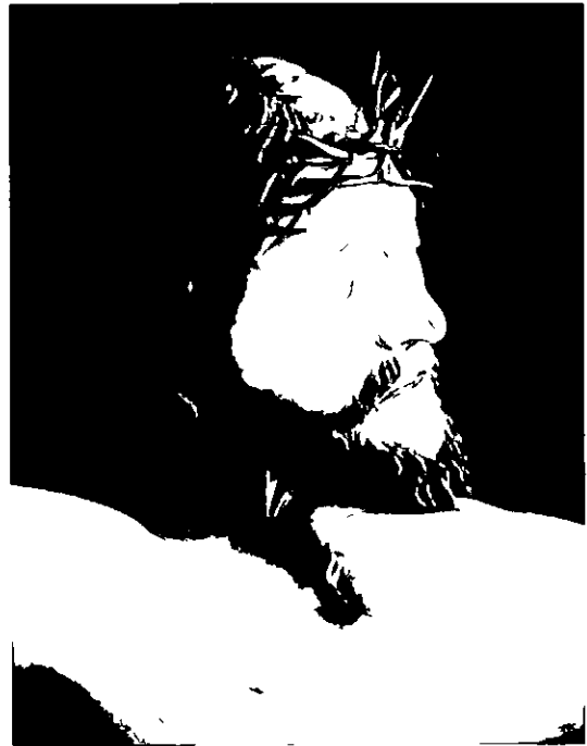
Cristo de la Buena Muerte

De una procesión apagada, muchas veces se bajaba a la Virgen en un camión a la iglesia del Carmen para subirla en procesión el domingo se consigue hacer uno de los desfiles procesionales más importantes del momento, que se traslada al domingo de Ramos y más tarde al Lunes Santo El trono de la Virgen con sus andas nuevas y la imagen con su manto, en 1971 se