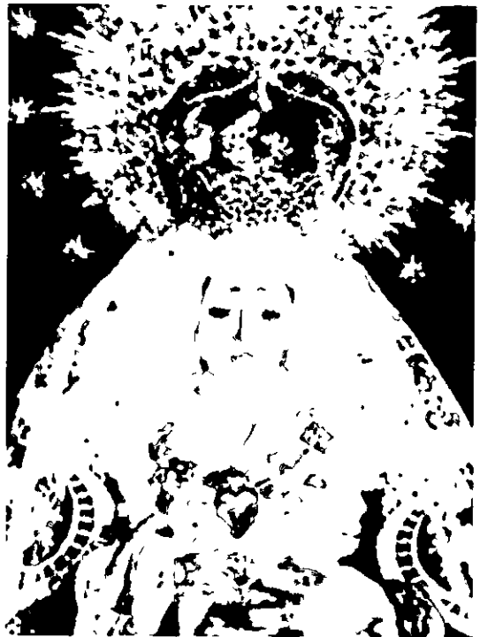
María Santísima de los Dolores

Con las puertas de la ermita abiertas de par en par es la hora del acercamiento, de la relacion mas intima. La ermita habitualmente cerrada, excepto la pequeña puertecita-mirador, ahora da la oportunidad a los devotos de tener contacto con esa Virgen, acogedora y bonita que los recibe con sus manos abiertas y que bajada de su camarín la han colocado a la altura de las personas, para reducir distancias y poderle hablar.