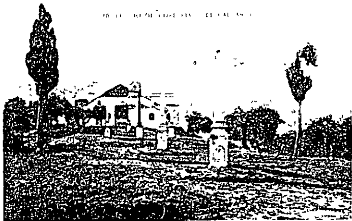
La ermita del Calvario de Priego a principios del siglo XX

Diversos autores del siglo XVIII y XIX hacen referencia en sus escritos a la ermita del Calvario como Pedro Alcalá-Zamora y Ruiz de Tienda, Ramírez de las Casas-Deza y Pascual Madoz. El primer testimonio gráfico lo hemos encontrado en el museo municipal dedicado a Lozano Sidro. Existe un cuadro al óleo que si bien es de regular factura en su ejecución, representa un documento valioso a nuestros ojos porque Federico Alcalá-Zamora Franco dibujó una vista general de Priego. Esta fechada el 28 de julio de 1867 y con el título Vista general de la Villa de Priego en la Provincia de Córdoba . Según nuestras investigaciones está dibujado aproximadamente desde el camino que existe en la Vega para llegar hasta el depósito de agua allí existente. La ermita pequeña, humilde, bucólica y sin pretensiones constructivas situada en la cuspide del monte, precedida de las cruces que se