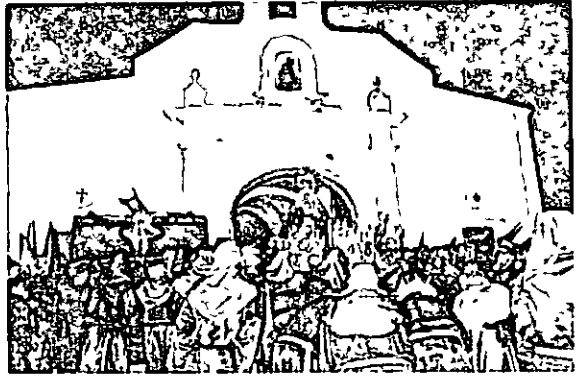
La Virgen de los Dolores saliendo de su ermita

echa para ocupar plaza en las numerosas cruces de la explanada. Se agarran como grano de uva a los racimos en malabarismos adaptados a su agilidad de jóvenes. Con ello tendran un panorama expedito para contemplar la escena sin ningun obstaculo. Asi las cruces, estaticas en su devocion durante todo el año, en su silencio ya de siglos, sirven de mirador y escalera para imberbes todavia faltos de una altura completa.