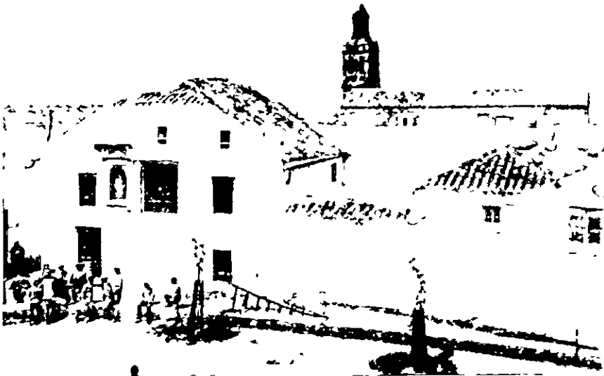
Vista de la casa donde nacio D. Alejandro Lerroux

Y entonces el paisaje se disloca. Echa uno cuesta abajo, entre caminos quebrados, se sumerge poco a poco en la trinchera de una rambla, ahí esta mi pueblo