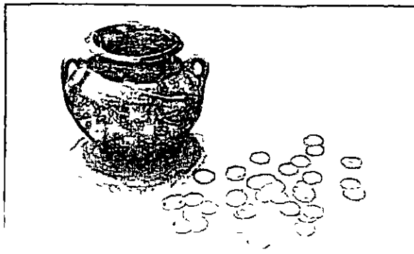
Lam III Jarra y parte del tesorillo

Las 161 monedas que presentamos son parte de un tesorillo compuesto por 1 500 dirhems sacados a la luz en 1996 por la mano clandestina de un expoliador residente en la vecina ciudad de Priego de Cordoba. El sujeto, M P C, según noticias llegadas a nosotros, dijo que halló las monedas diseminadas en superficie junto a una fragmentada vasija de barro en el cortijo de Peñalosa . El recipiente y las monedas corrieron diferentes suertes (vid nota nº 18). 38 fueron entregadas con la fragmentada olla, hoy reconstruida (lam 3), al Museo Histórico Municipal de Priego de Cordoba 17 , otras se repartieron o vendieron y el resto (161 monedas) fue intervenido por la Guardia Civil (SEPRONA) y depositado en el Museo Arqueológico Provincial de Córdoba 18 . Son estas últimas (149 en un album de 16 hojas y 12 en una bolsa) las que presen-