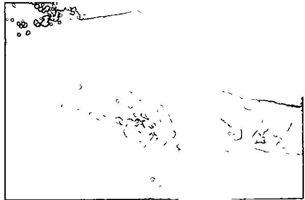
Lam II Cortijo de Peñalosa

El citado cortijo se ubica a Sudeste del Cerro de Las Cabezas , junto al camino que partiendo de Fuente-Tojar circunda al Cerro en dirección a la aldea de La Cubertilla . El toponimo le viene dado debido a un gran peñasco que hay al Norte de la vivienda formando parte de sus paredes (lam 2). La casa, de construcción moderna, es una de las muchas dispersas en la zona adscritas a la mencionada aldea de la que dista seiscientos metros. Es de buena fábrica con dos niveles de varias estancias y elementos decorativos en sus alacenas y armarios empotrados. Los tejados se disponen a dos aguas con el entramado de vigas a manera de "pie de tijera". Posee patio interior pajar, establos zahurdas y otras