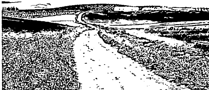
Vereda de Cañete de las Torres a Las Gavias, a la derecha el Cortijo del Fiscal.