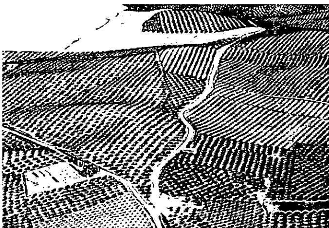
Vereda de Cañete de las Torres a Lopera, que parte de la carretera de Cañete a Villa del Río.

Morrón”, con dirección a Cañete de las Torres, atraviesa una parte del término de Porcuna con la dirección del indicado camino por el pago del “Barranco”, y al llegar al sitio “Cruz del Pestño”, continúa entre el término de Porcuna y Cañete, dando cada uno la mitad de la Vereda, por servir el camino de línea jurisdiccional, hasta llegar al “Cortijo de los Alamillos”, que entra la vereda en el término de Cañete, continúa su