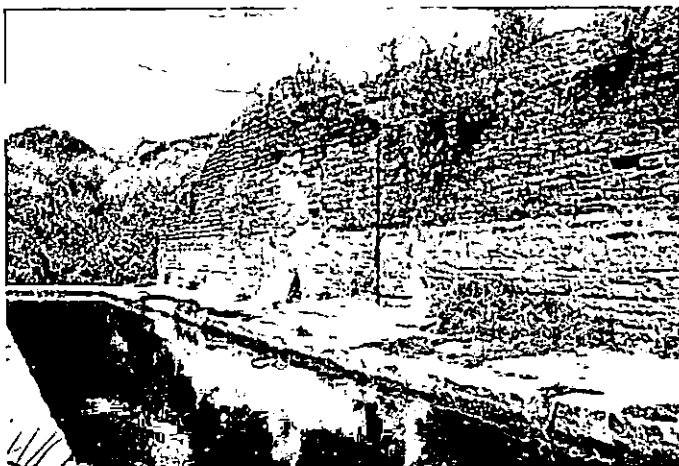
Abrevadero-descansadero del "Pilar de Rabanera", junto a la vereda de Cañete a Baena.