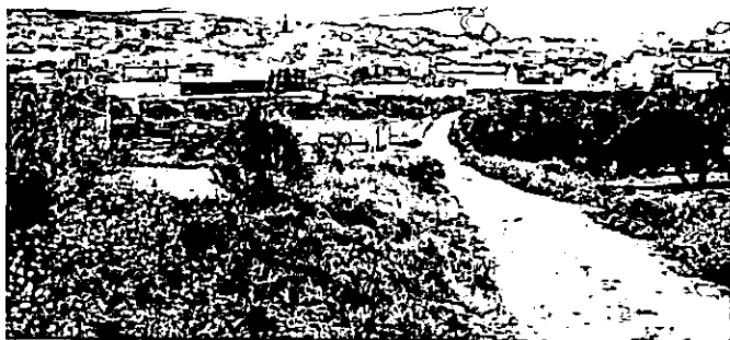
Vereda de Cañete de las Torres a Baena.

dirección del camino viejo de Baena a Cañete de las Torres, llevando por la derecha el "Cortijo Almacenes", "Haza Larga" del Cortijo de Colmenillas y otra de la "Cortija" y, por la izquierda, el "Cortijo Colmenillas", pasa por un pozo abrevadero de ganados, hasta llegar a la carretera de Bujalance a Valenzuela, vía pecuaria denominada "Cordel de Granada".