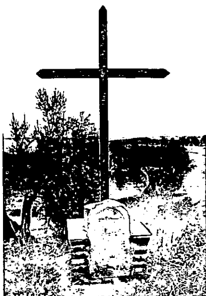
Sitio llamado "Cruz del Pestiño" junto a la vereda de Cañete a Lopera, repuesta en 2002

Se deriva del Cordel de Bujalance a Porcuna al cruzar el Arroyo de la Carrasquilla en el Cortijo de los Alamillos, sigue paralela al citado Arroyo con la dirección del Camino de Arjona, por el Cortijo de los Alamillos, hasta que sale al término de Porcuna de la provincia de Jaén, por donde continúa. Esta vereda no figura en la información testifical, de fecha 4 de Octubre de 1.951, base de este trabajo, pero teniendo en cuenta que, en los antecedentes existentes en el Servicio de Vías Pecuarias del término de Porcuna por donde continúa, consta el camino de Arjona como vía pecuaria con una anchura de veinte metros, ochenta y nueve (20,89 m.) equivalentes a 25 varas, se incluye en este Proyecto el citado camino de Arjona, como vía pecuaria y con la misma anchura, para que tenga su continuidad y enlace en su corto recorrido por este término de Cañete de las Torres.