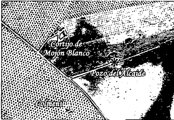
Abrevadero del "Pozo del Alcaide", junto al Cordel de Granada, entre los Cortijos de Mojón Blanco y Colmenillas.

aproximadamente de seis mil cuatrocientos metros cuadrados (6.400 m 2 ).