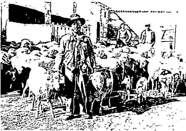
Rebaño de ovejas en el Cortijo del Villar, localizado junto a la vereda de Cañete de las Torres a Baena. Década de 1950.

rarse económico-política, pues aseguraba a la hacienda real un fácil cobro de tributos sobre la trashumancia.