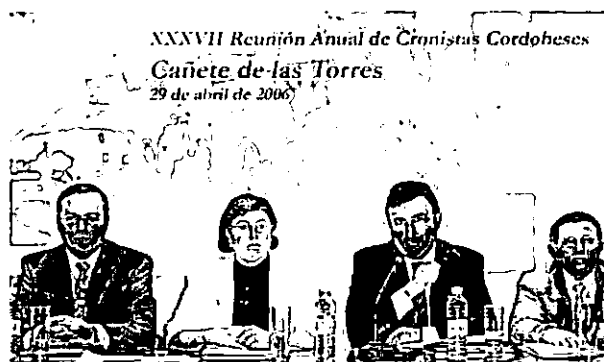
Mesa presidencial en la XXXVII Reunión anual celebrada en Cañete de las Torres