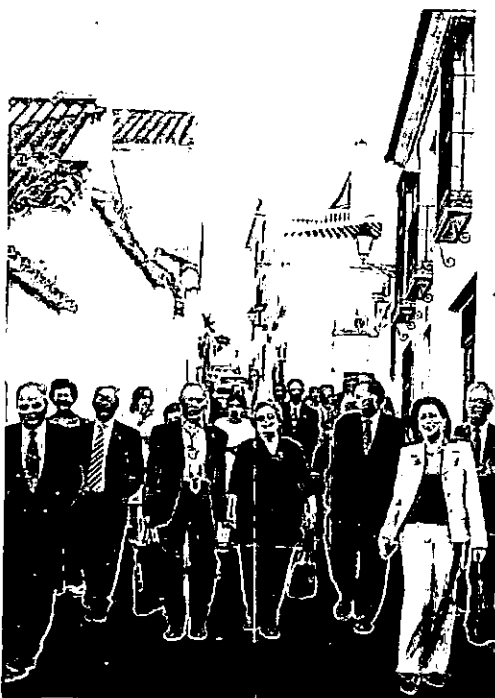
Cronistas y acompañantes paseando por Cañete

Alternativamente a las sesiones de trabajo, muchos de los acompañantes habían girado visita a la Ermita de Jesús, antigua Ermita de la Vera Cruz y a las Cruces de Mayo. Más tarde,