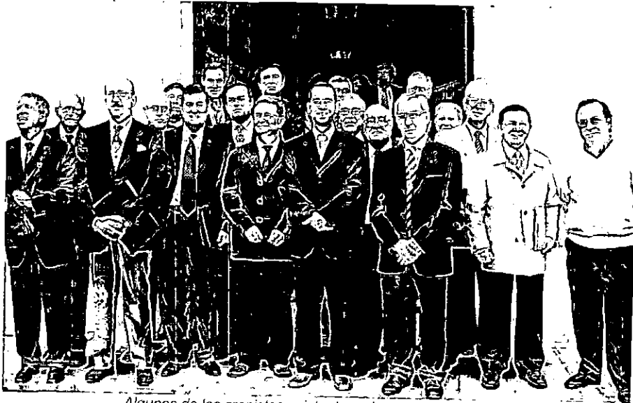
Algunos de los cronistas asistentes a la reunión de Cañete

Finalizado el acto de recepción, todos los asistentes se desplazaron hasta el salón de actos de la Caja Rural "Ntra. Sra. del Campo", donde tendría lugar el