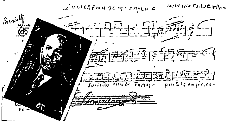
El maestro compositor Carlos Castellano

Este fecundo autor e ilustre montalbeño, consiguió que su música alcanzara las más altas cotas de audición en el mundo entero.