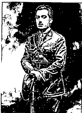
Ilustr. 6: Esta foto fue la que apareció en el periódico ABC de Madrid el 9/04/1937 con la noticia de su fusilamiento.

Pablo Neruda hace a Carcabuey y con la publicación de la noticia de su muerte por el periódico ABC de Madrid 8 .