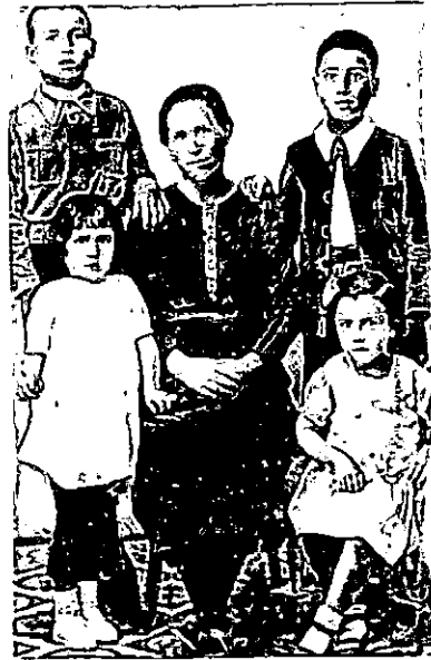
Ilutr. 9 y 10: Fue sargento en el ejército republicano y cruzó la frontera francesa cuando las tropas de Franco llegaron a Cataluña. Su familia le envió una foto y tuvo muchas dificultades para salir adelante.

Mientras tanto, en el pueblo, su mujer sobrevivía como podía, pues fue muy difícil sacar adelante a sus hijos sin la ayuda de nadie. Trabajó muy duramente, pero eso no fue suficiente. Desde las cuatro y hasta las ocho y media de la mañana limpiaba en el café La Almeja. A las nueve se iba al campo para ganar un jornal recogiendo aceitunas. Otras veces segaba o arrancaba garbanzos y otras, limpiaba en las pocas casas de quienes podían pagar esos menesteres. Por la noche guisaba y hacía las tareas del hogar, y al día siguiente volvía a empezar. Pero a pesar de todo ello, ganaba tan poco que no le quedó más remedio que aceptar que los hijos mayores se fueran a vivir con personas de confianza. La hija más pequeña se quedó con ella y se la llevaba consigo. A la hora de la comida, la veían tan pequeña y desvalida que, por vergüenza y lástima, las señoras de las casas donde limpiaba le daban de comer.