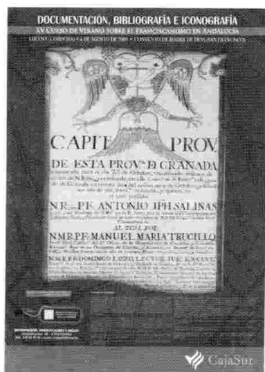
Cartel XV Curso Verano.