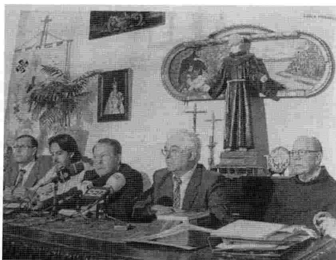
Inauguración del Curso.